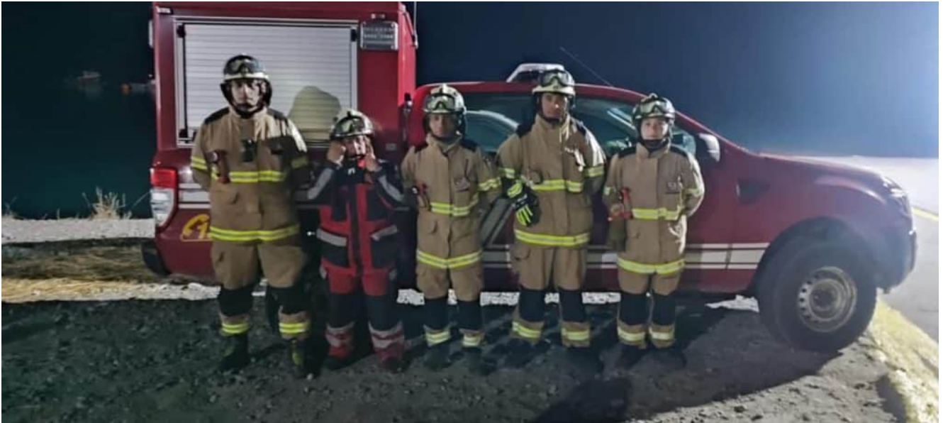
5 voluntarios del Cuerpo de Bomberos de Hualaihué