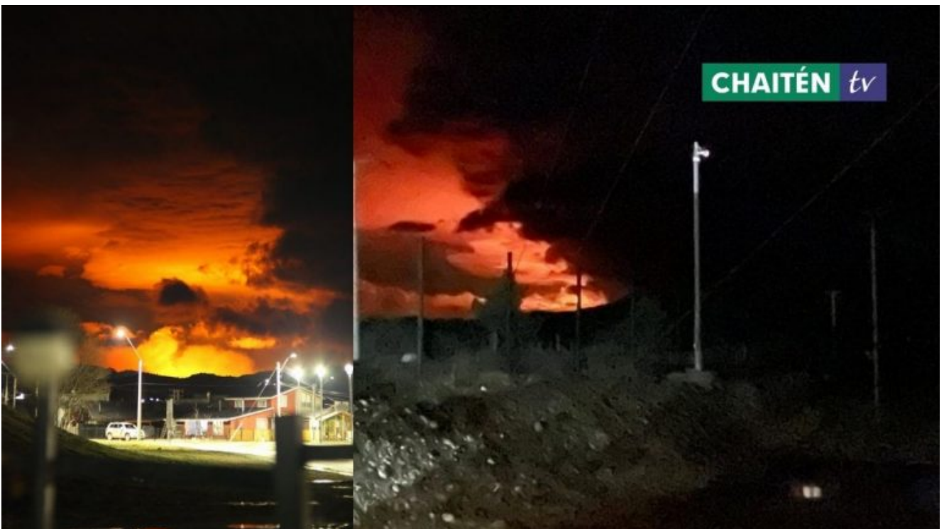
Un incendio forestal afecta al Parque Nacional Patagonia, en