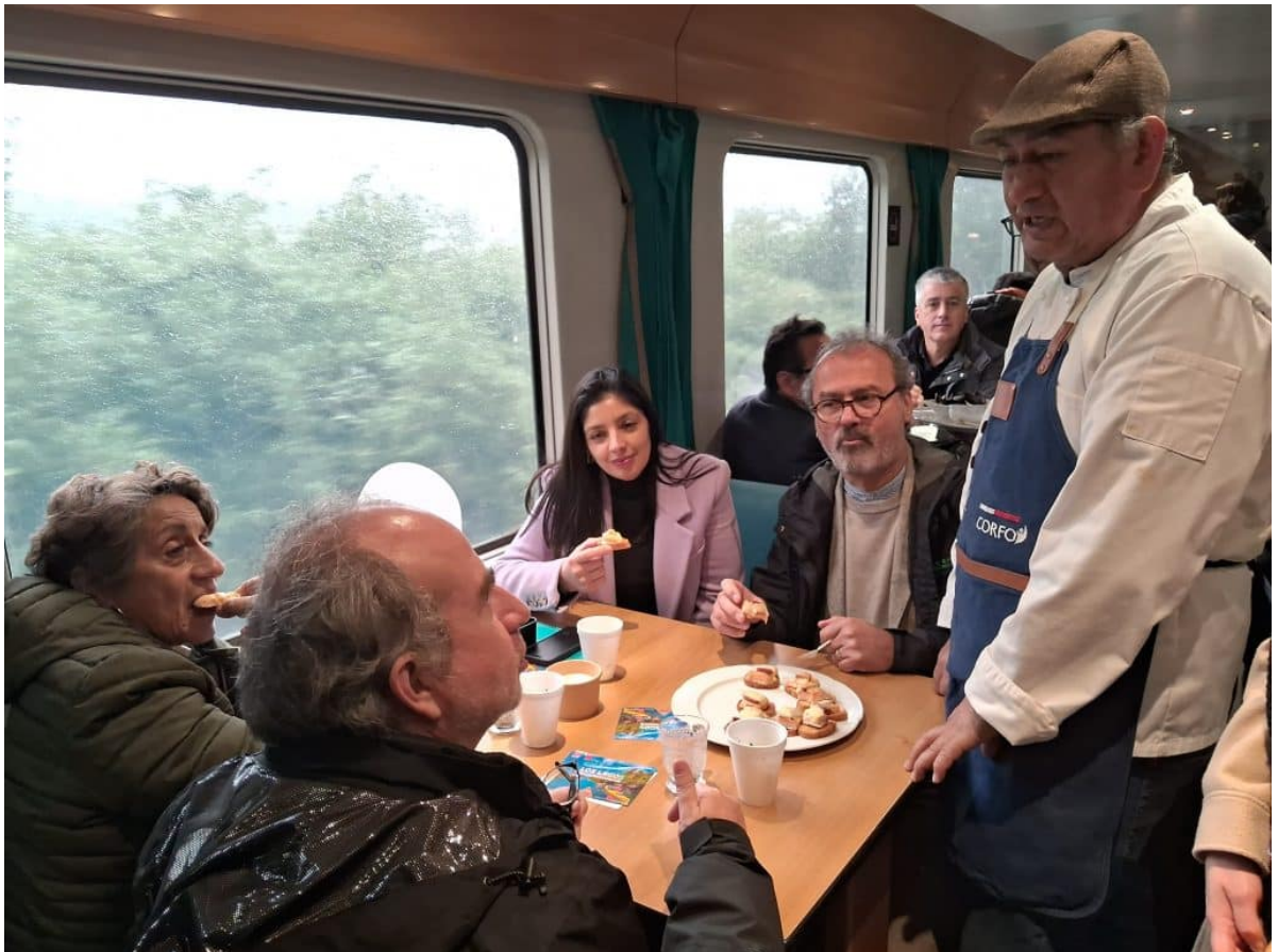
Las actividades de celebración del Día Mundial del Turismo, en