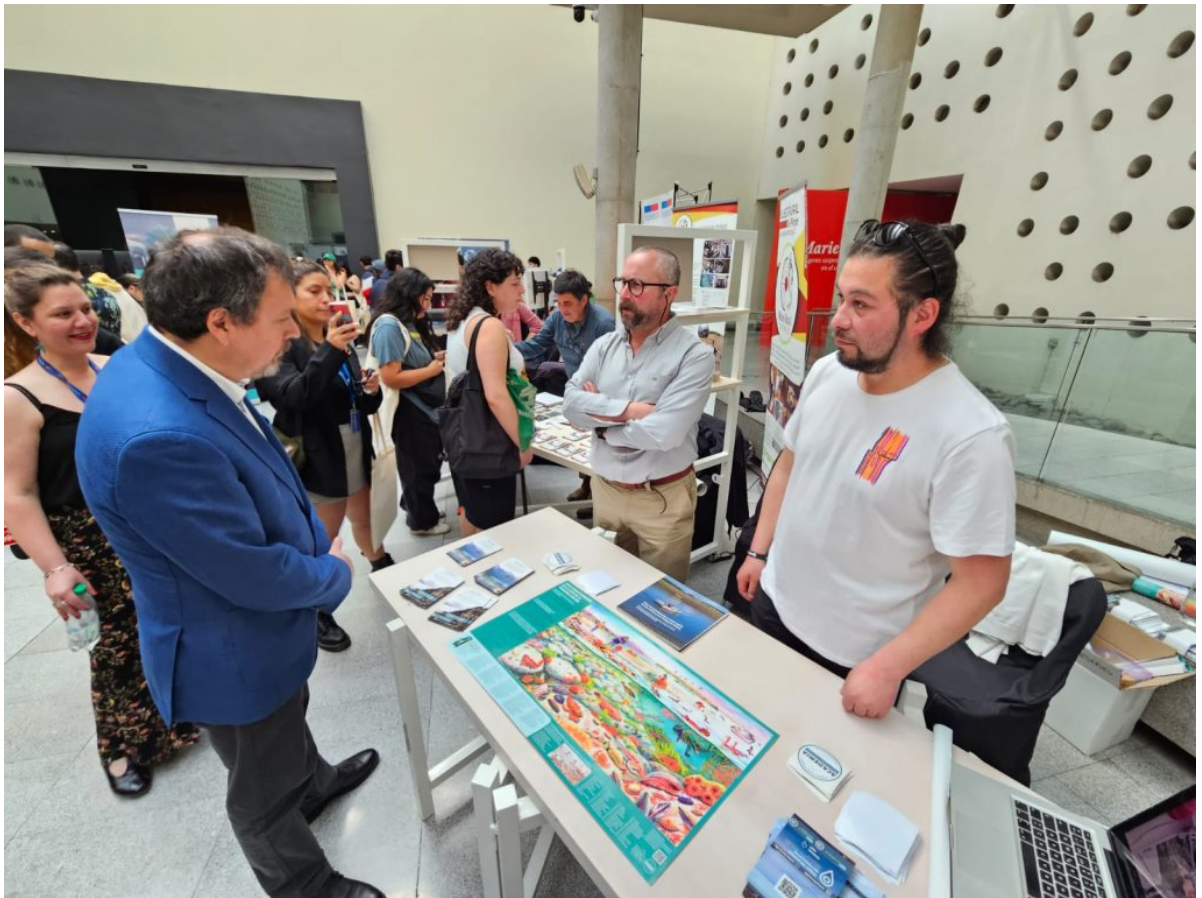
Durante el Encuentro Nacional de Áreas Protegidas y