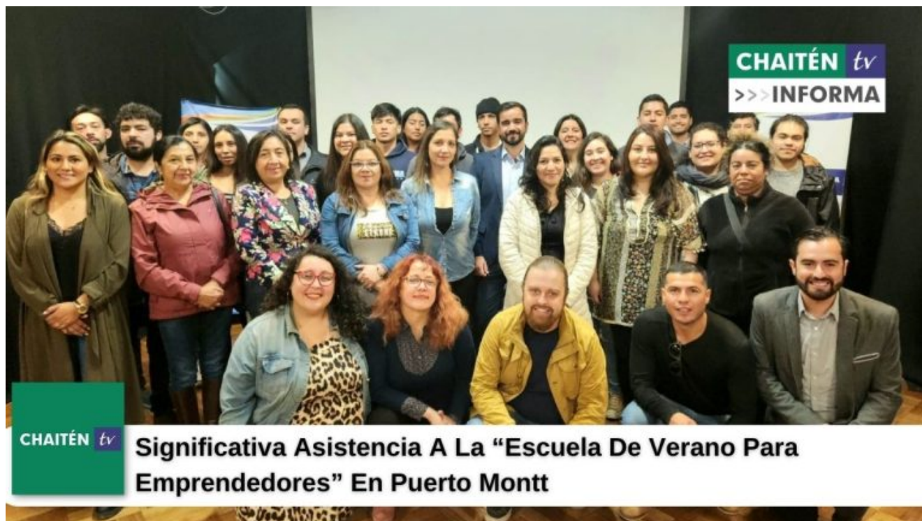
Significativa Asistencia A La “Escuela De Verano Para Emprendedores” En Puerto Montt

Revelando que a pesar del efecto negativo de la pandemia y la crisis económica en nuestro país los emprendedores y emprendedoras locales siguen visualizando oportunidades para iniciar nuevos negocios en la Región de Los Lagos. Sin embargo, la necesidad de conocimiento sobre materias técnicas, legales y administrativas es fundamental y pueden cambiar el rumbo de sus negocios, determinando su éxito o fracaso.